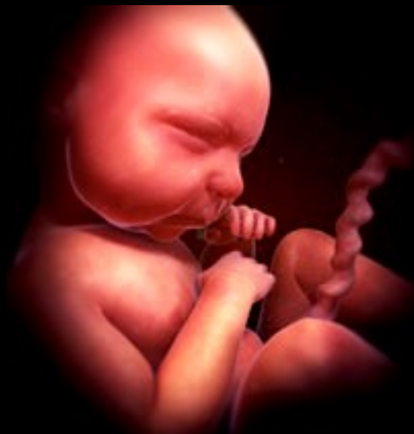
Embryon 40 semaines Il patiente en dormant.