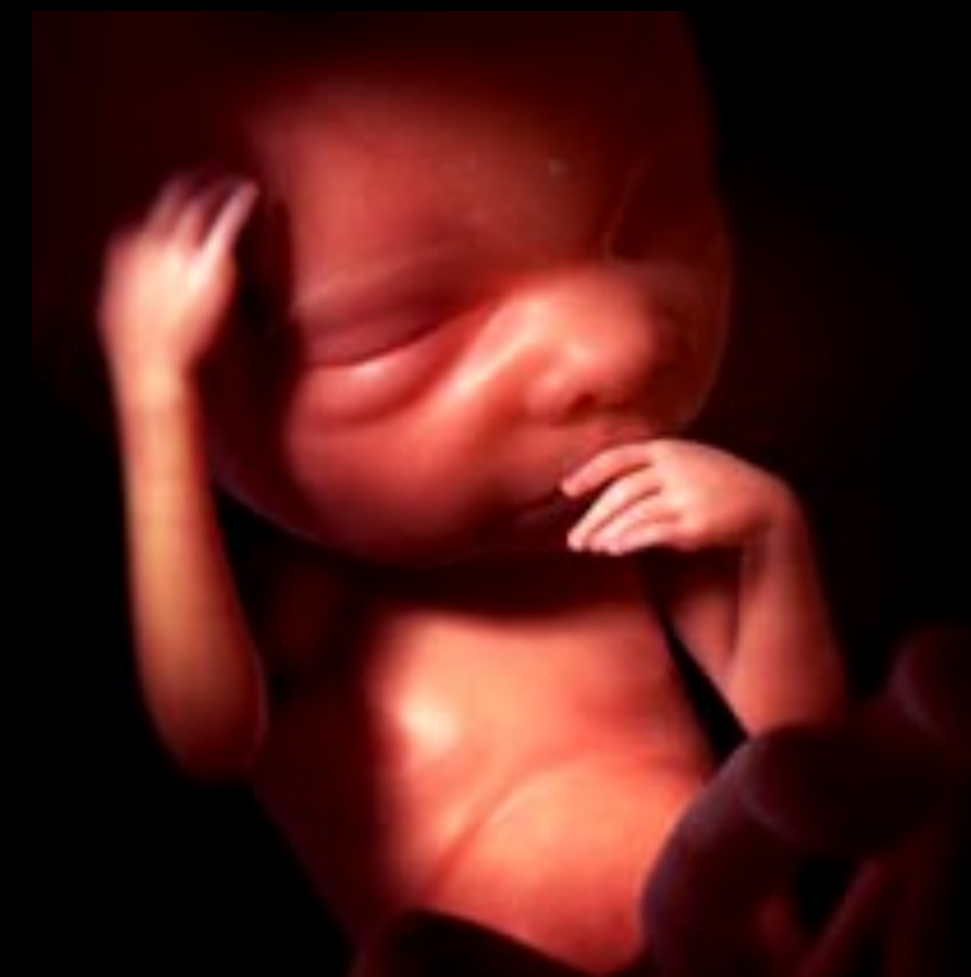
Embryon 24 semaines Ses cheveux commencent à pousser. Il ouvre ses yeux.