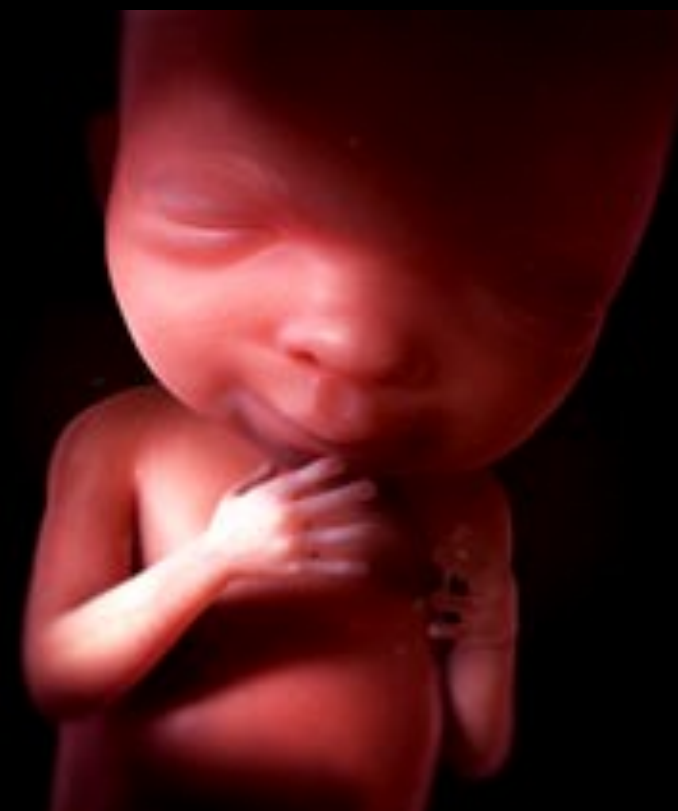
Embryon 20 semaines Vous commencez à le sentir bouger. On peut connaître son sexe.