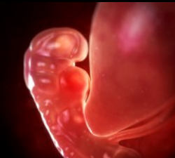
Embryon 2 semaines