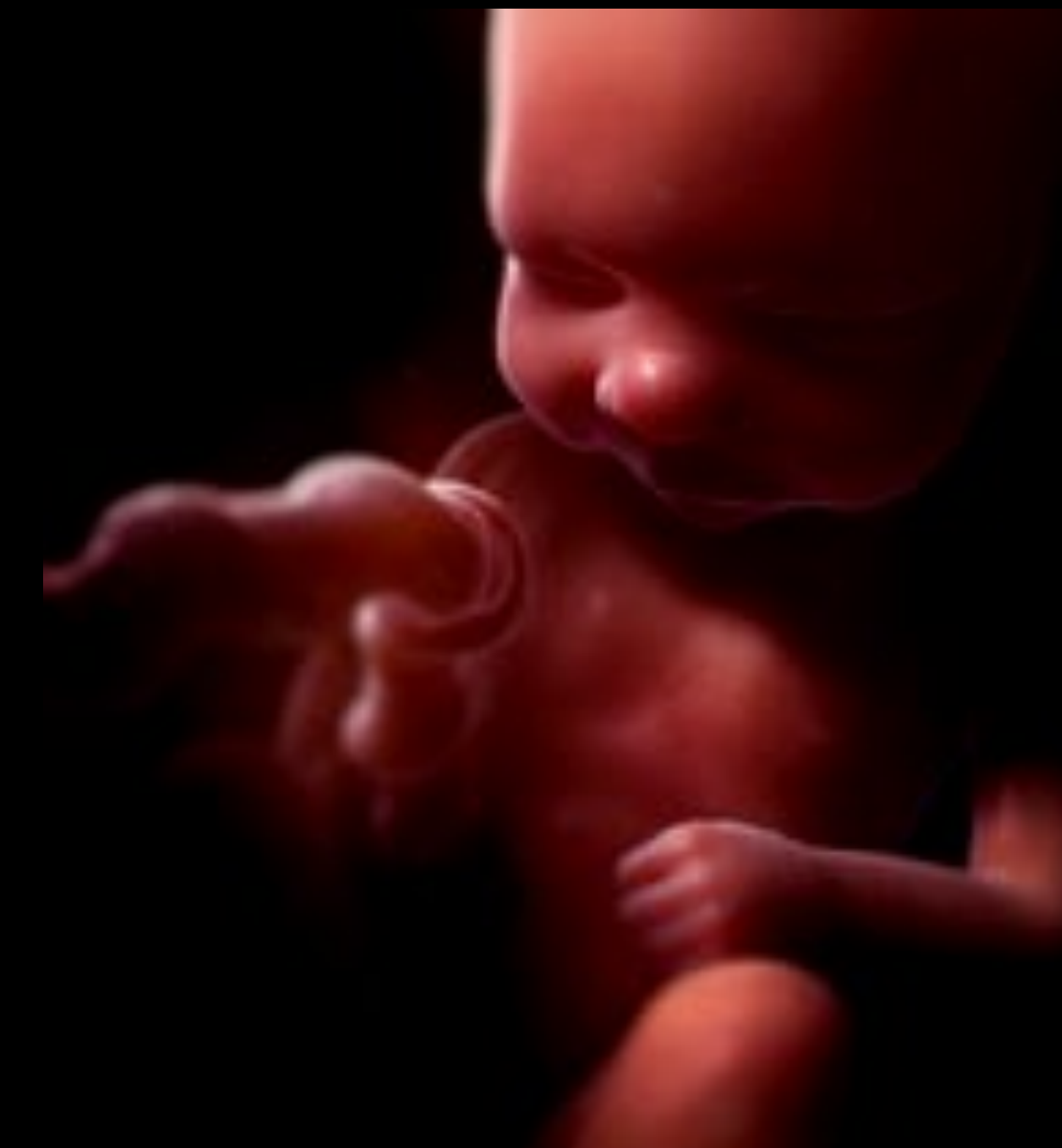
Embryon 32 semaines Il gigote beaucoup. Il garde les yeux ouverts.