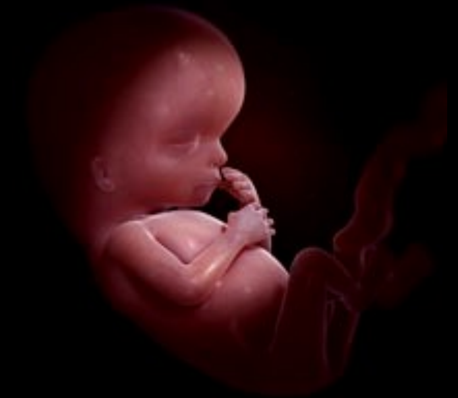
Embryon 16 semaines Il développe le sens de l'ouïe.