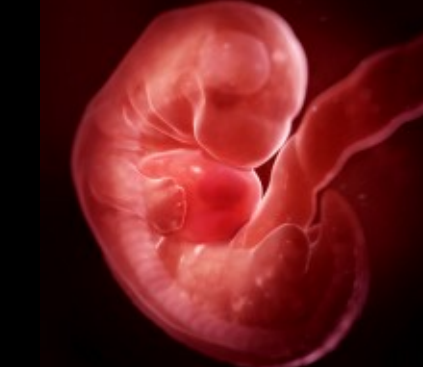
Embryon 8 semaines Il commence à bouger. Développement du cerveau.