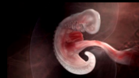
Embryon 4 semaines Le tube neural et les premiers battements du cœur.