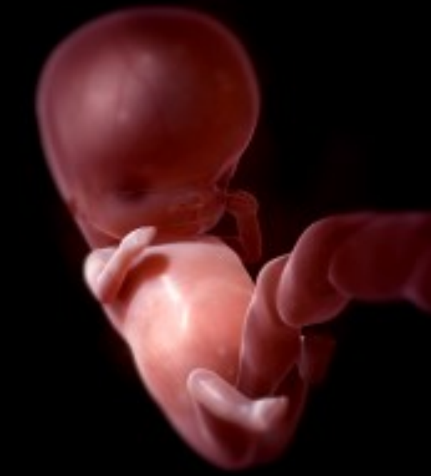
Embryon 12 semaines Ses ongles commencent à pousser. Le développement de la colonne vertébrale et de la moelle osseuse