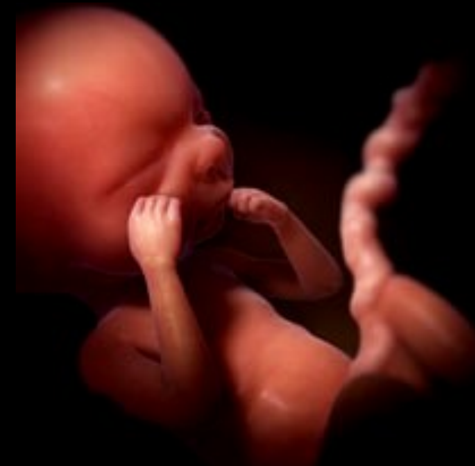
Embryon 28 semaines Développement des poumons.