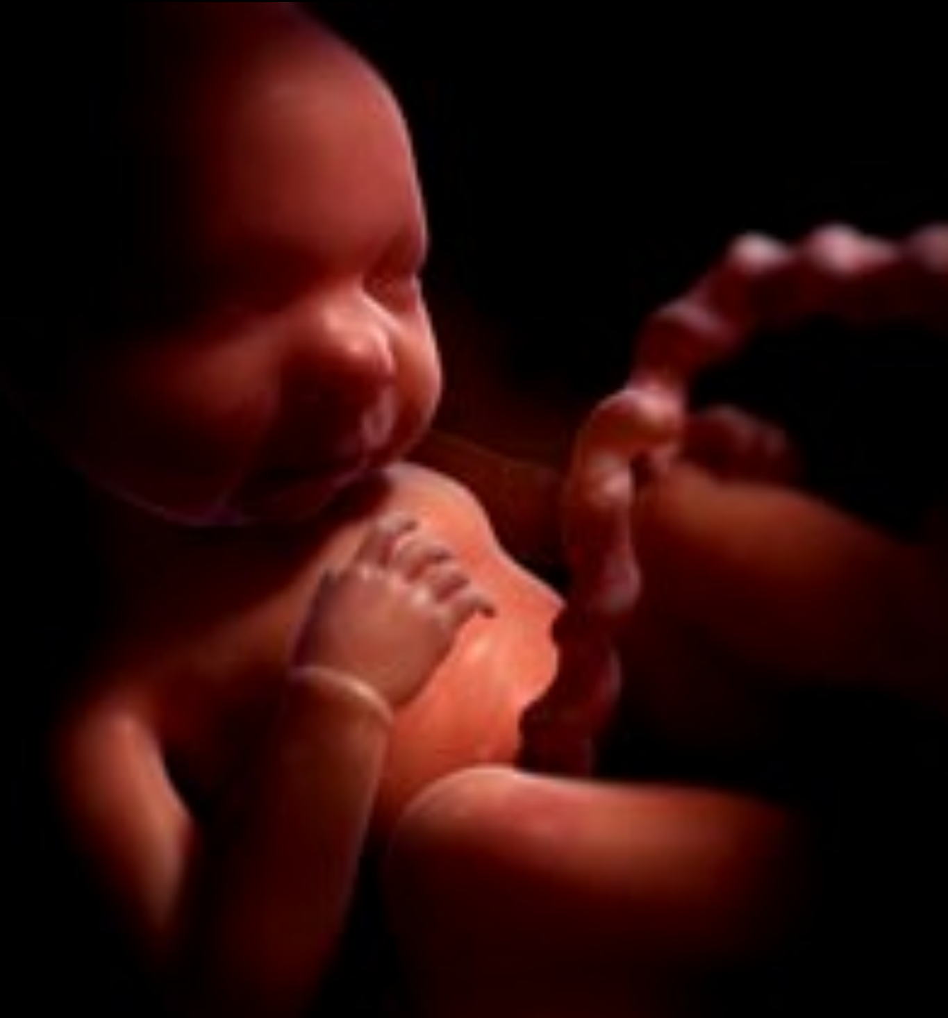
Embryon 36 semaines Il s'entraîne à respirer. Son cerveau atteint la maturité.